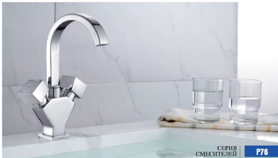
СЕРИЯ СМЕСИТЕЛЕЙ P76